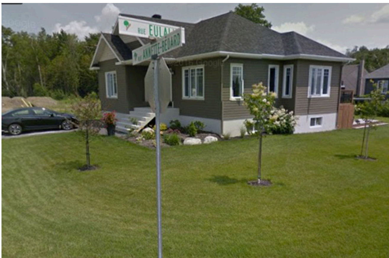
FOTO 3. Rue Annette Bedard

ha arricchito la conoscenza e il gusto non solo delle sue allieve e allievi ma anche dell'intera popolazione. Promotrice dagli anni sessanta agli anni novanta dello scorso secolo di mostre, spettacoli, vernissage ha decisamente dato un grande contributo artistico alla sua comunità, che ora ne riconosce i meriti. È stata posta infatti anche una sua targa identificativa, che ne racconta le azioni, nel settore toponomastico vicino alla Via di Sainte-Victoire, pensato per ricordare con placche commemorative e ridare lustro alle donne importanti per il territorio.