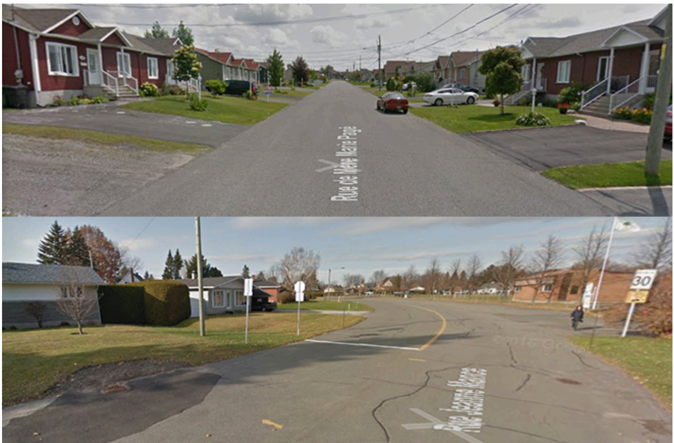
FOTO 1. Rue de Mère Marie Pagé e rue Jeanne Mance

Qui nel 1642 dedica il suo operato alla cura delle bisognose e dei poveri, fondando l'Ospedale Dieu di Montréal, il primo ospedale dell'America del Nord, di cui seguirà i lavori di realizzazione e ne diventerà direttrice dal 1659 al 1673 accettando la presenza di religiose a servizio.