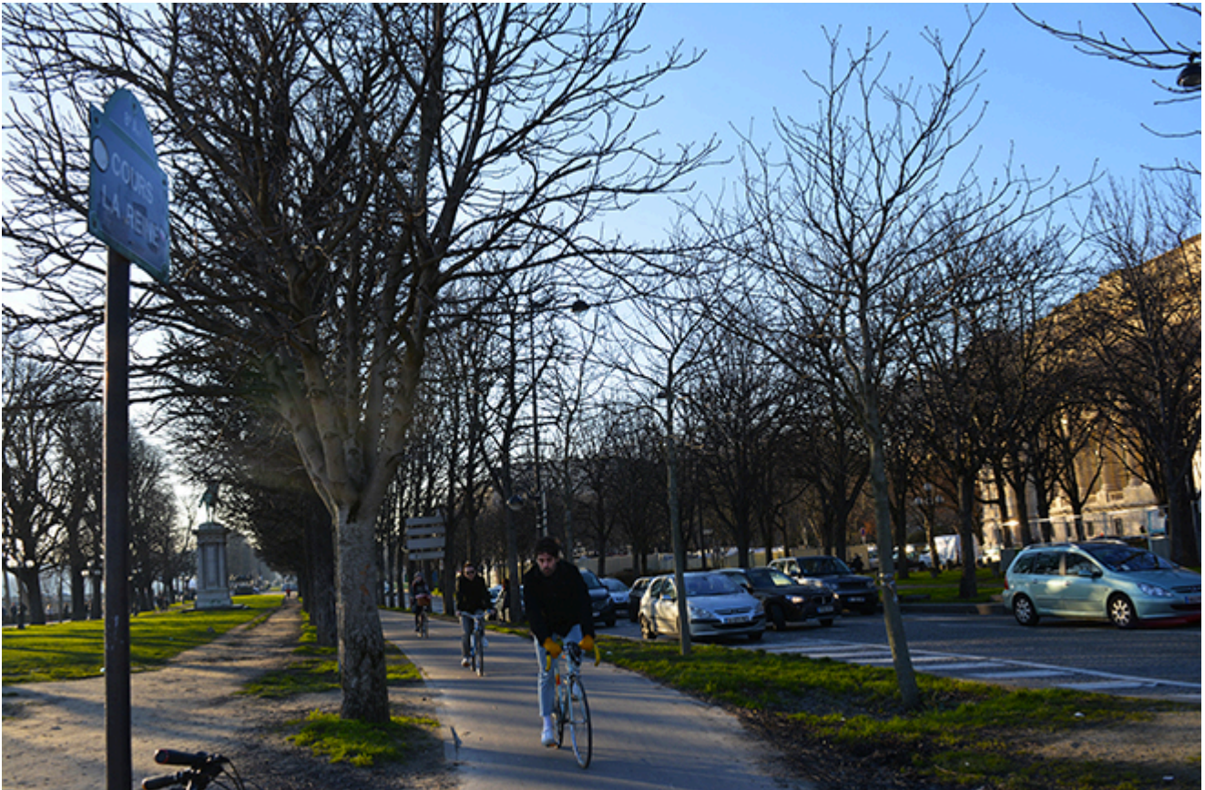
Foto 1. La promenade

Nell'8° arrondissement di Parigi, subito dopo la Place de la Concorde, si estende il Cours la Reine. Aperta nel 1618 da Maria de' Medici su antiche coltivazioni di orticoltori, questa "promenade" si estendeva originariamente dal giardino delle Tuileries alla piazza della regina Astrid. Costruita appositamente per la regina Maria e riservata alle sue amicizie alto-borghesi, la passeggiata le permetteva di camminare dal suo castello a Tuileries, lungo la Senna, senza essere disturbata dal traffico cittadino.