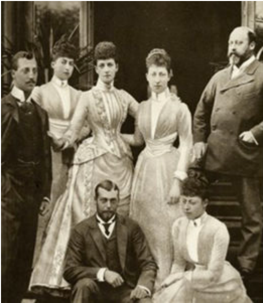
FOTO 1. Re Alberto con la sua numerosa prole tra cui Louisa, la futura Consorte del Governatore Generale del Canada