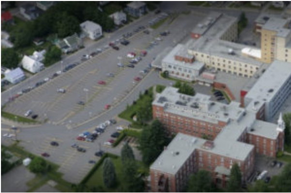
FOTO 2. Ospedale Arthabaska

della popolazione più povera. Anche a lei, nel 1996 è stata dedicata una via, in un'area ricca di intitolazioni femminili