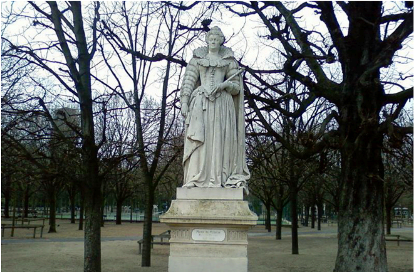
Foto 5. Statua di Maria de Medici ai Giardini del Lussemburgo