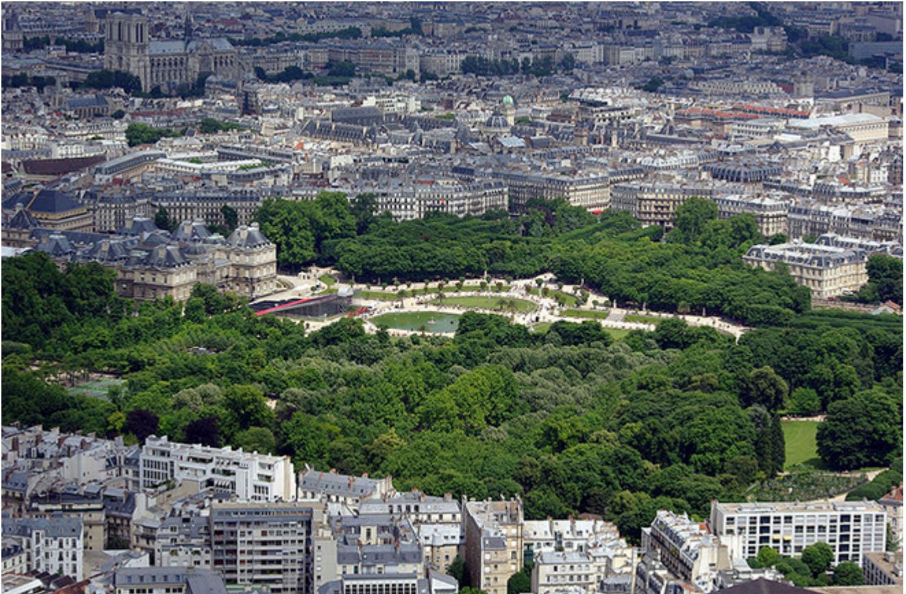
Foto 3. Palazzo e Giardini del Lussemburgo

Pochi anni dopo (1622), venne riammessa al Consiglio di Stato. Grazie al nuovo ruolo acquisito e ai privilegi riottenuti, Maria tentò di riottenere anche la corona, e per questo sostenne il più possibile l'ascesa del duca di Richelieu, che viene nominato cardinale ed entrò a far parte del Consiglio reale. Tuttavia, Richelieu da subito si mostrò decisamente ostile alla politica estera progettata da Maria, decidendo di ribaltare tutte le alleanze strette con la Spagna fino a quel momento. L'ex regina tentò di opporsi e di indurre il re a non approvare il piano progettato da Richelieu. La congiura, tuttavia, non ebbe esito positivo, perché il cardinale venne a conoscenza dei vari complotti, e nel corso di un colloquio con Luigi XIII lo indusse a punire i congiurati e a ritornare sulle proprie decisioni. L'11 novembre del 1630 (quello che passerà alla storia come "Journée des Dupes", la "giornata degli ingannati"), Richelieu fu riconfermato primo ministro, i suoi nemici definitivamente rovesciati e Maria de' Medici costretta all'esilio. Dopo aver perso qualunque autorità, la