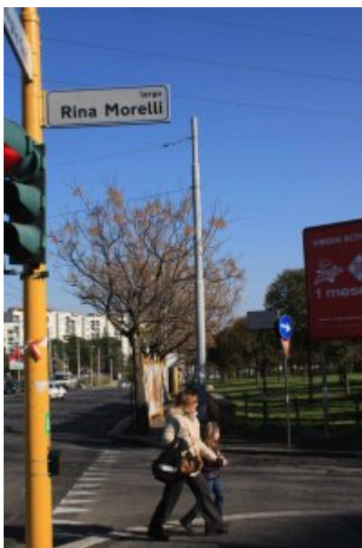
FOTO RINA MORELLI

L'odonomastica del III municipio rievoca anche molte attrici di teatro, per esempio Pupella Maggio, il cui vero nome era Giustina. Come lei stessa racconta, a due anni venne portata in scena dentro uno scatolone, legata proprio come una bambola perché non scivolasse fuori. Così il suo destino fu segnato: da "Pupatella", attraverso la poupée francese, divenne per tutti "Pupella" nel teatro e nella vita.