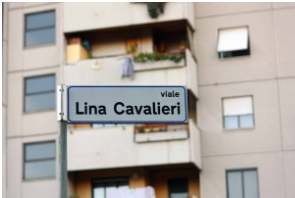
FOTO LINA CAVALIERI