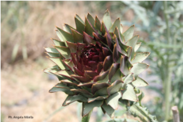
Ph. Angela Milla