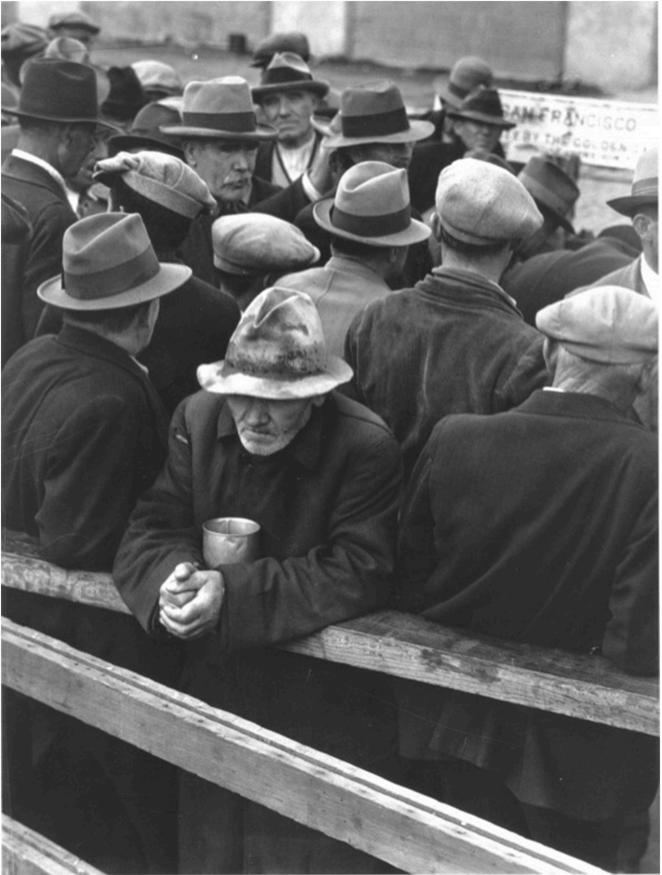
Risale al 1933 la foto White Angel Breadline , eseguita a San Francisco. C'era davvero un angelo alle spalle della