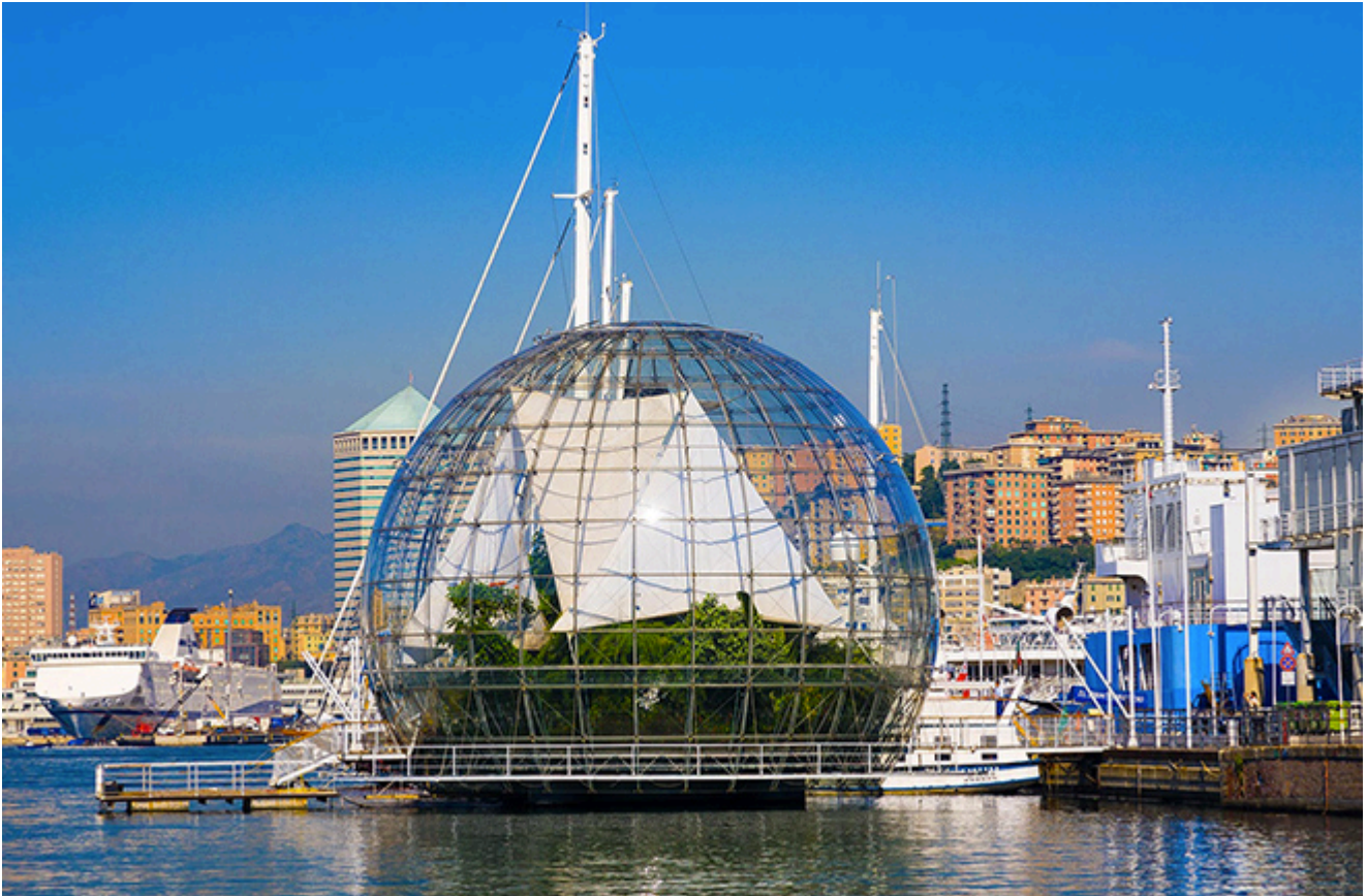
Foto 7. Il porto antico di Genova