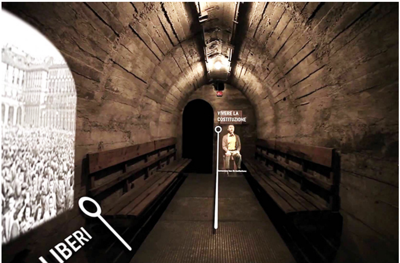
Foto 9. Museo diffuso della Resistenza