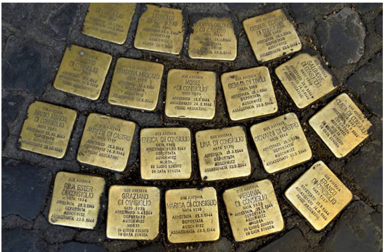
Foto 10. Pietre d'inciampo a Roma