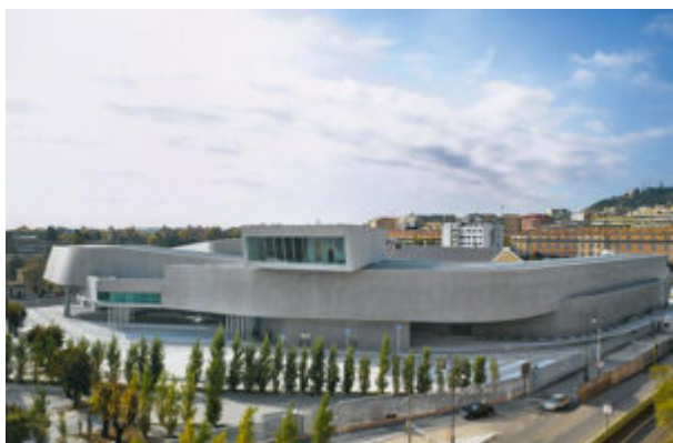
Foto 1. MAXXI

Al crescere del livello culturale medio, non solo Roma, ma ogni metropoli occidentale ha sentito il bisogno di musealizzarsi.