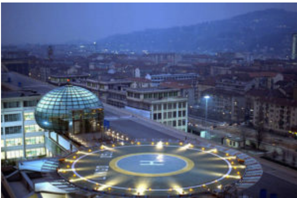
Foto 8. Il Lingotto a Torino

Non mancano esempi d'oltreoceano di strutture diffuse e periferiche: il Museum of Modern Art di New York, ha aperto una seconda sede nel Queen, spostando le rotte turistiche al di fuori di Manhattan, mentre il Contemporary Museum di Baltimora si è spinto ben oltre, rinunciando alla stabilità di una sede per votarsi al nomadismo espositivo, tra hangar, sale da ballo, garage e conventi...