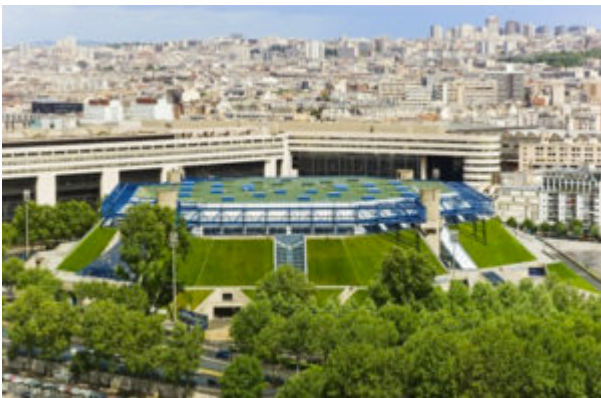
Foto 3. Bercy

Parigi ha osato per prima, nel 1976, erigendo il Centre George Pompidou sulle ceneri dei maleodoranti mercati del Beaubourg, e ha continuato, dieci anni più tardi, riconvertendo un'antica stazione ferroviaria nel Musée d'Orsay e gli antichi mattatoi de La Villette in centro culturale polifunzionale e polimorfico, con annessi musei della scienza e della musica; a seguire, sono stati i depositi portuali di Bercy a permearsi di cultura, per essere emulati, di lì a poco, dai malfamati docklands londinesi. Anche la storia sociale si fa largo tra le strade parigine e porta allo scoperto le tradizioni artigianali, sotto le volte ristrutturature del Viaduc des Arts, che ribadisce l'identità artigiana del dodicesimo arrondissement.