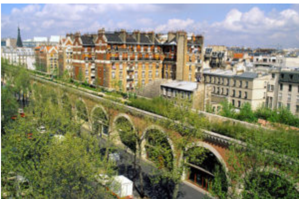
Foto 4. Viaduc des Arts

La capitale britannica ha raccolto la sfida inaugurando la