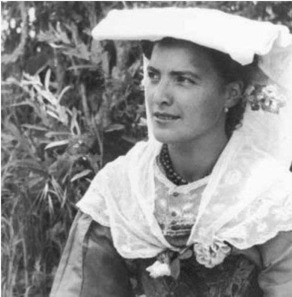
FOTO 1. Modella di Anticoli Corrado

parenti (e di tutta la popolazione locale) ad accettare questa attività. Il legame fra l'arte e la popolazione diventa, di anno in anno, sempre più forte e intenso, tanto che fare la modella (o il modello) diventa un lavoro vero e proprio.