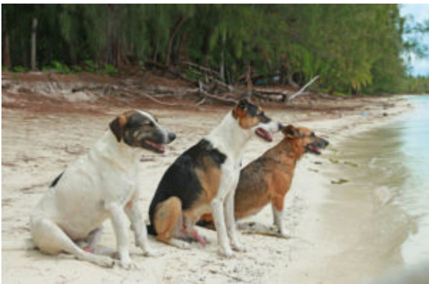
Foto 3. Cani in spiaggia

Queste isole da favola mi hanno fatto pensare ai francesi che le hanno colonizzate: sono stati bravi, le popolazioni sono tranquille e serene, sembrano ospitali e solidali, vivono in luoghi curati e rispettano i vecchi, i bambini e l'ambiente. A proposito, siccome la sepoltura dei morti in cimitero è costosa, molti seppelliscono i loro cari in giardino. Abbiamo visto parecchi esempi.