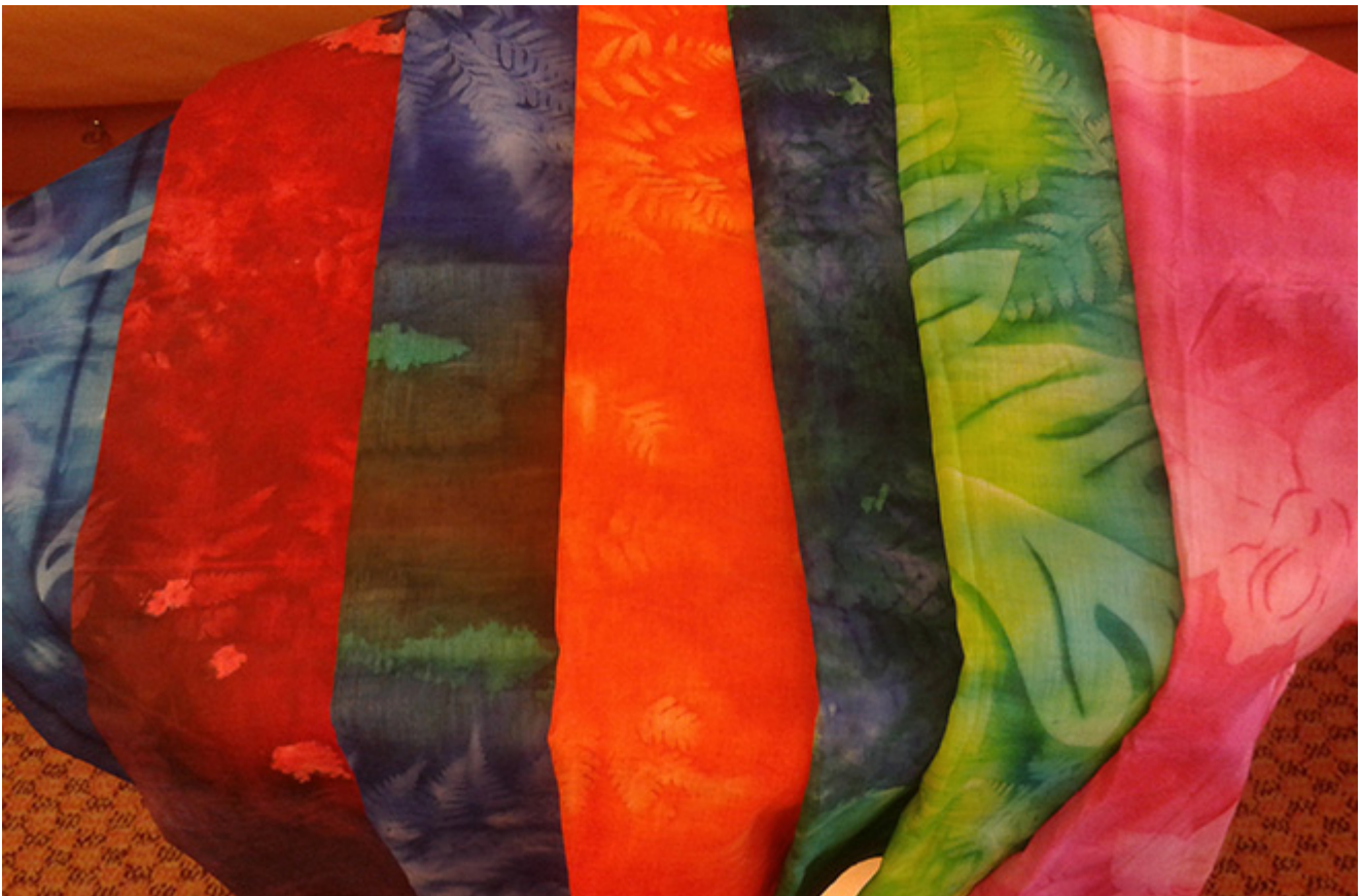
Foto 2. I colorati parei

Comprare un pareo che ha i colori e i disegni tipici di questi luoghi non vuol dire soltanto avere in valigia qualcosa da regalare, ma aiutare queste ragazze che vivono insieme, nelle casette dove lavorano e vendono. Mi sussurrano che sono ragazze-madri o giovani vedove. Intorno qualche bambino, nessun uomo adulto. Sono dignitose, allevano i loro figli, lavorano onestamente e, sempre, sorridono, anche con gli occhi.