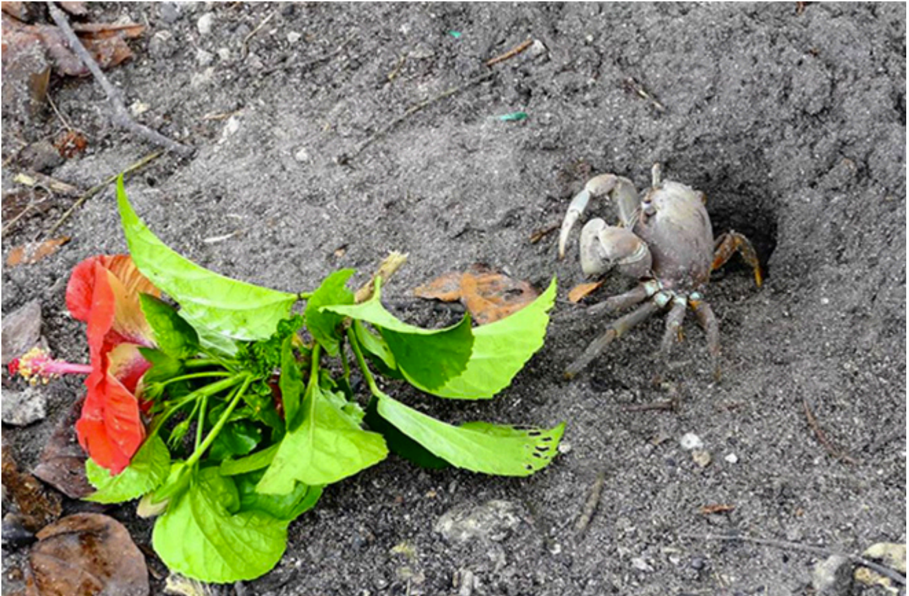
Foto 4. Granchi all'opera

La tappa polinesiana è finita: dei luoghi, delle persone, del truck e dei granchi rimane un ricordo luminoso e sereno.