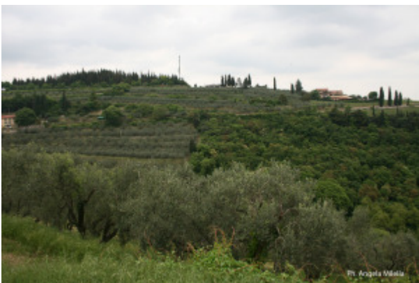
Ph. Angela Mella