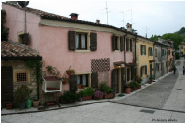
Ph. Angelo Mella