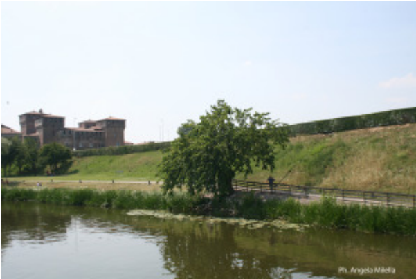
Ph. Angela Merello