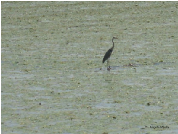
Ph. Angela Mella