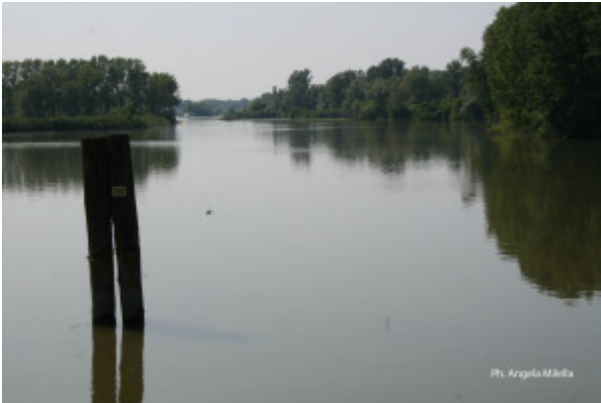
Ph. Angela Mikić