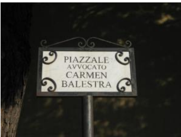
AVVOCATO (Francavilla Fontana (BR))