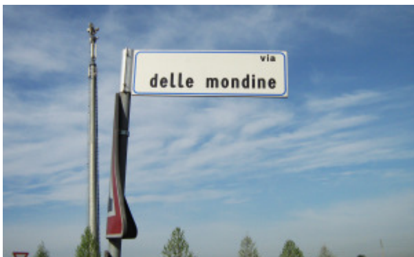
MONDINE (Carpi (MO))

I mestieri hanno sempre visto la presenza femminile – contadina, parrucchiera, sarta... – mentre le professioni sono state sempre appannaggio della componente maschile, tant'è che i nomi che le definiscono sono declinati al maschile.