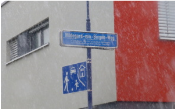
ILDEGARD (Friburgo)