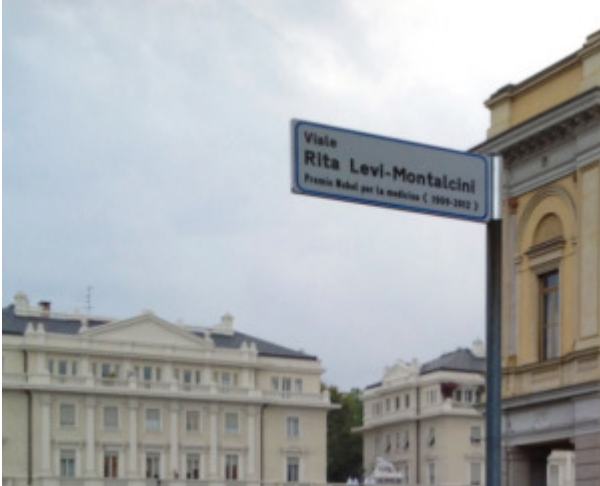
RITA LEVI MONTALCINI (Morbegno (SO) –)