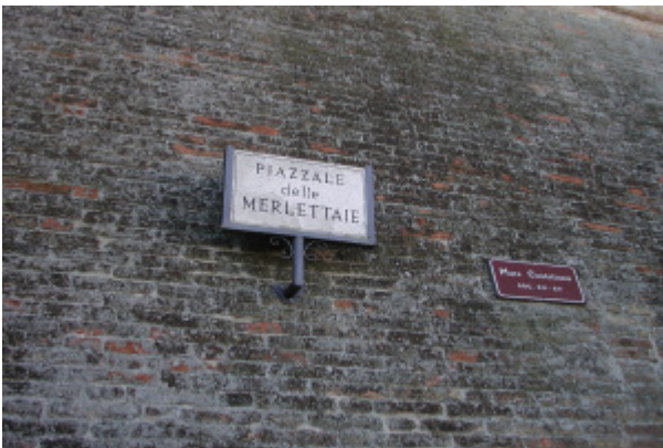
MERLETTAIE (Offida (AP))