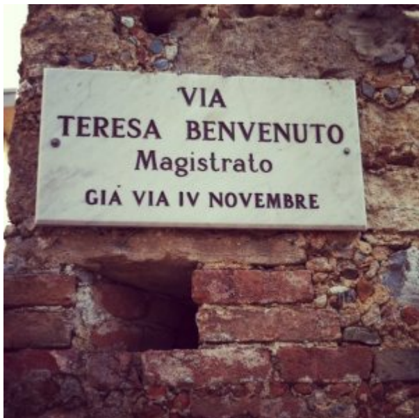
MAGISTRATO (Diamante (CS))

L'assenza di tracce e riconoscimenti femminili sul territorio porta a riproporre stereotipi di genere largamente superati dalla reale dinamica sociale, che vede le donne protagoniste della vita scientifica, culturale e politica.