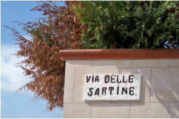
SARTINE (Brindisi)