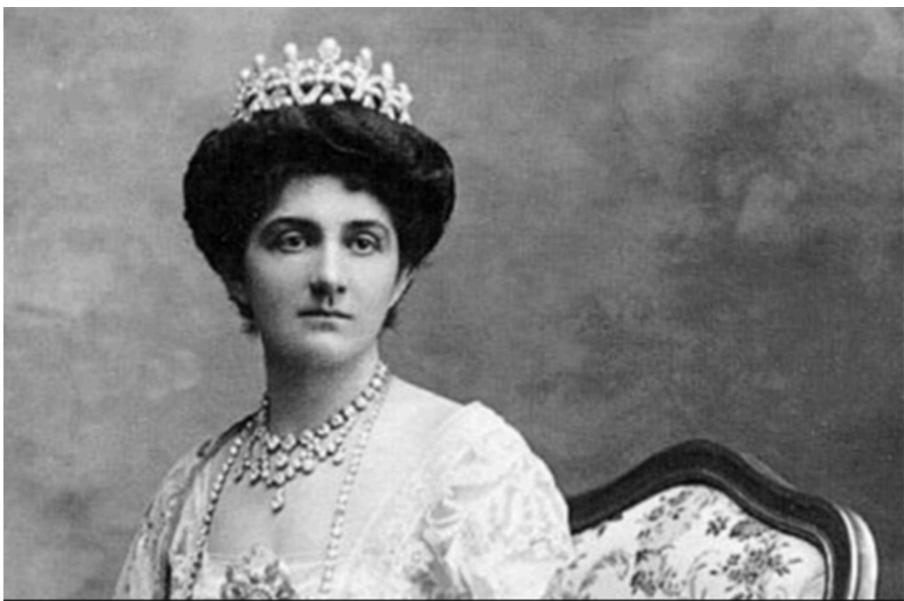
FOTO 5. Elena di Montenegro

delle leggi razziali. Terminata la guerra, il 9 maggio del 1946, Vittorio Emanuele III abdicò a favore del figlio Umberto e andò in esilio con Elena ad Alessandria d'Egitto, ospite di re Farouk. Elena rimase in Egitto fino alla morte del marito, avvenuta il 28 dicembre del 1947, dopo diciannove mesi d'esilio, poi si trasferì a Montpellier, dove morì di cancro il 28 novembre del 1952.