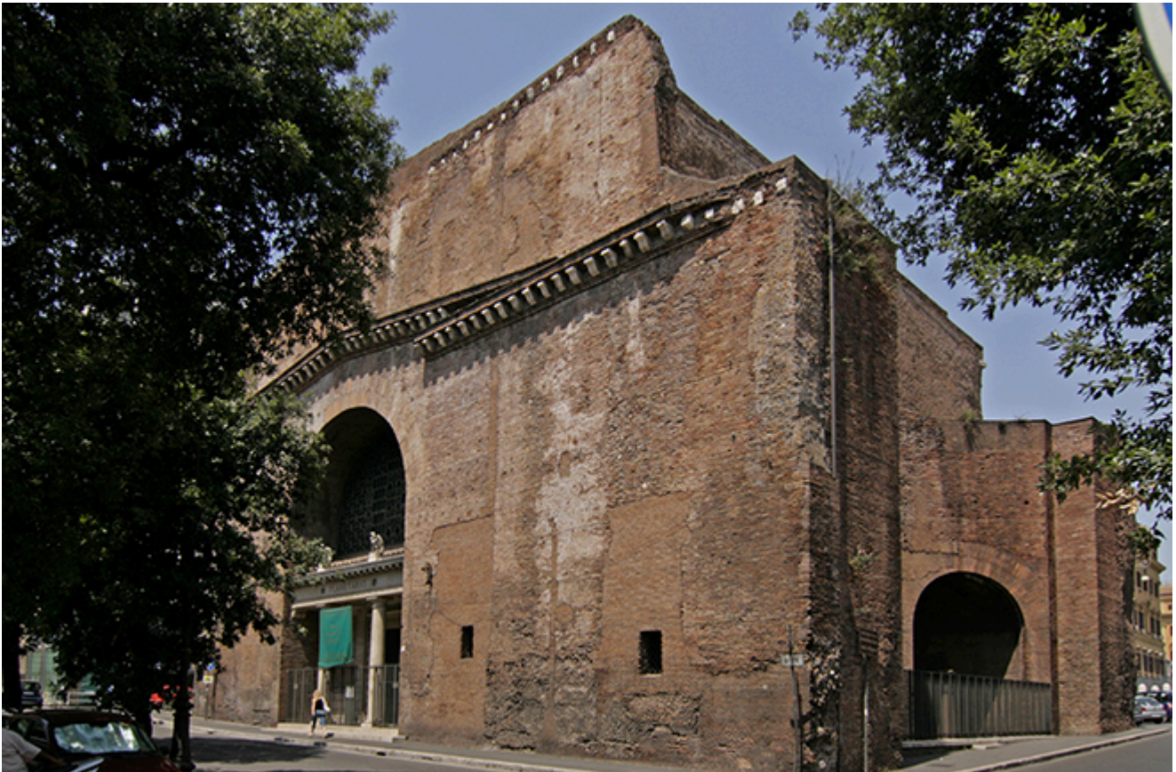
FOTO 3. Aula ottagonona

reticolo geometrico poggiato su colonnine metalliche con capitelli di ghisa. L'esterno dell'edificio fu ripristinato secondo i canoni dell'architettura fascista: due colonne doriche sostengono una trabeazione dominata dalle aquile imperiali. Dal 1979 la Soprintendenza archeologica ha iniziato un progetto di musealizzazione.