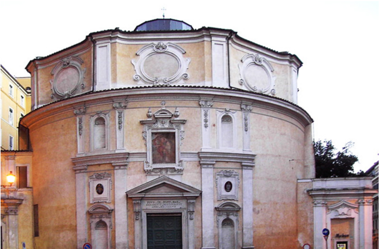
FOTO 6. Chiesa di San Bernardo alle terme