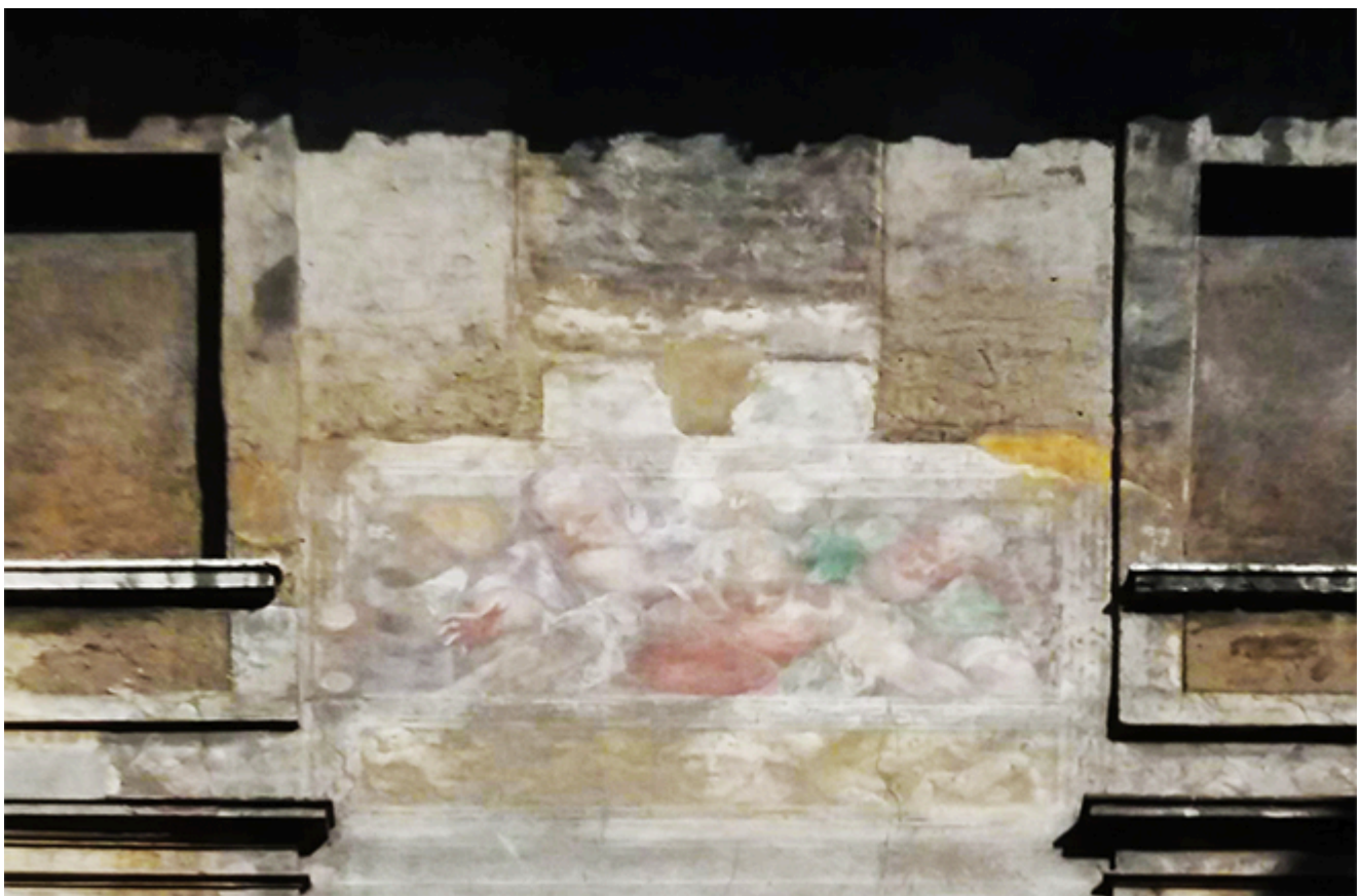
FOTO 2. Particolare dell'affresco di Lattanzio Gambara in via XXIV Maggio lungo una parete dell'edificio delle poste

delle quali, particolare per i notevoli affreschi del '500 con scene di storia romana di Lattanzio Gambara, è stata inglobata nell'edificio delle poste; edifici di importante valore storico quali le antiche pescherie, il macello risalente al Quattrocento, la chiesa romanica di Sant'Ambrogio, i resti della curia ducis romana, le fondamenta della cinta urbana tardo-antica, di una torre, di un palazzo ducale di età longobarda, tre resti di ponti sul torrente Garza. Nel 1970, durante gli scavi per la costruzione del parcheggio sotterraneo terminato nel 1974, vengono ritrovati altri importanti resti risalenti alle età imperiale e longobarda e, nel 2008, durante gli scavi per la realizzazione della metropolitana di Brescia, vengono alla luce le fondamenta di una torre di epoca medievale.