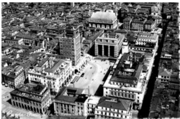
FOTO 3b. Cartolina d'epoca. Piazza della Vittoria dall'aereo

Secondo alcuni studi l'impianto si ispirerebbe, sia pure con alcune differenze, alla disposizione della piazza minore di San Marco a Venezia, quella che, oltre il Canal Grande, guarda alla chiesa di S. Giorgio. Come nella chiesa palladiana infatti il lato meridionale della piazza, su cui si affaccia l'edificio della Banca Commerciale, è l'unico ad avere un