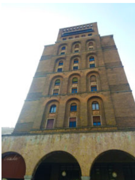
FOTO 4. Grattacielo INA

Come a Venezia il lato sinistro è il più classico e si chiude sull'angolo retto interno alla piazza con il Torrione; unico edificio in mattoni come il celebre campanile di S. Marco, ovvero il grattacielo di proprietà dell'INA, il primo in Italia e uno dei primi in Europa, una struttura di cemento armato alta 57 metri, che ricalca il gusto eclettico dei primi grattacieli statunitensi, nonostante il regime imponga di definirlo "edificio multipiano" o "torrione".