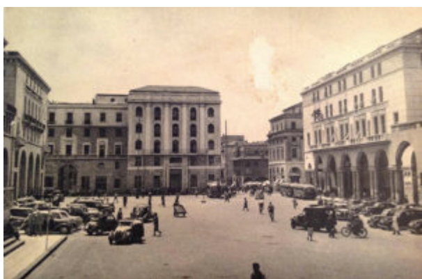
FOTO 3a. Cartolina d'epoca. Piazza Vittoria

Piazza della Vittoria è progettata come spazio solenne per le celebrazioni e, allo stesso tempo, spazio di vita quotidiana.