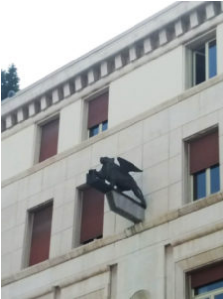
FOTO 5. Il leone alato in bronzo sulla facciata dell'edificio delle Assicurazioni Generali

Sul lato settentrionale della piazza si affaccia la sobria facciata del palazzo delle Poste, con il suo rivestimento in bicromia bianco-ocra; un simbolo civico, in quanto l'edificio sarebbe dovuto diventare il nuovo palazzo comunale, in sostituzione della storica sede di Palazzo Loggia, di cui riprende la triplice apertura, abbandonando però gli archi a favore di tre alti fornicati sormontati da architravi. La fitta cortina muraria del lato settentrionale è attraversata da vie pedonali, il quadriportico e una galleria, volutamente allineate alle strade provenienti dalla piazza delle cattedrali per creare un legame con la maglia viaria scomparsa, e a nord-est della piazza una grande scalinata, che contorna il Palazzo delle Poste, colma il dislivello creatosi tra Piazza Vittoria e il piano costituito da Piazza della Loggia e via X Giornate.