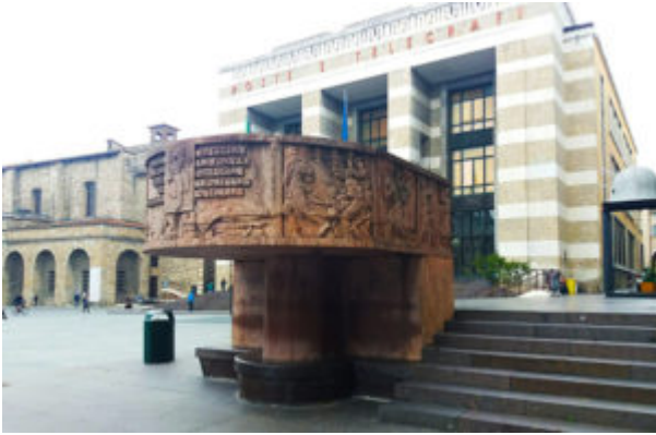
FOTO 7. L'arengario in pietra rossa

Come nella città lagunare, il lato destro della piazza, su cui prospettano palazzo Peregallo, l'edificio della Riunione Adriatica di Sicurtà, il nuovo albergo Vittoria e le sale per le contrattazioni commerciali volute dal Consiglio provinciale dell'economia, contrappone alla monocromia del sinistro il colore, ma del bianco e del verde della scacchiera che impreziosivano le facciate ora resta solamente un labile alone.