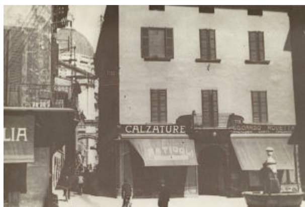
FOTO 1. Cartolina d'epoca. Piazzetta delle Pescherie, 1929

che sorge nel luogo in cui i Longobardi, dopo aver messo la città a ferro e fuoco, insediano nel VII secolo il loro primo accampamento, a ovest delle antiche mura romane e sulle rive del torrente Melo, rinominato Garza in età medievale, per svilupparsi poi nei secoli a ridosso delle principali piazze cittadine (Piazza della Loggia, Piazza Duomo e Piazza del Mercato) e diventare uno dei principali luoghi del commercio di pesce, formaggio, carne e granaglie in città. Popolarmente noto anche come “serraglio” e ricco di osterie e bordelli, è popolato da oltre seicento famiglie, più di tremila persone, che vivono in case strette e alte fino a 25 metri, affacciate su vicoli oscuri e tortuosi, in condizioni igienico-sanitarie che sono considerate le peggiori della città, tanto che la cultura fascista paragona il quartiere a un tumore da estirpare.