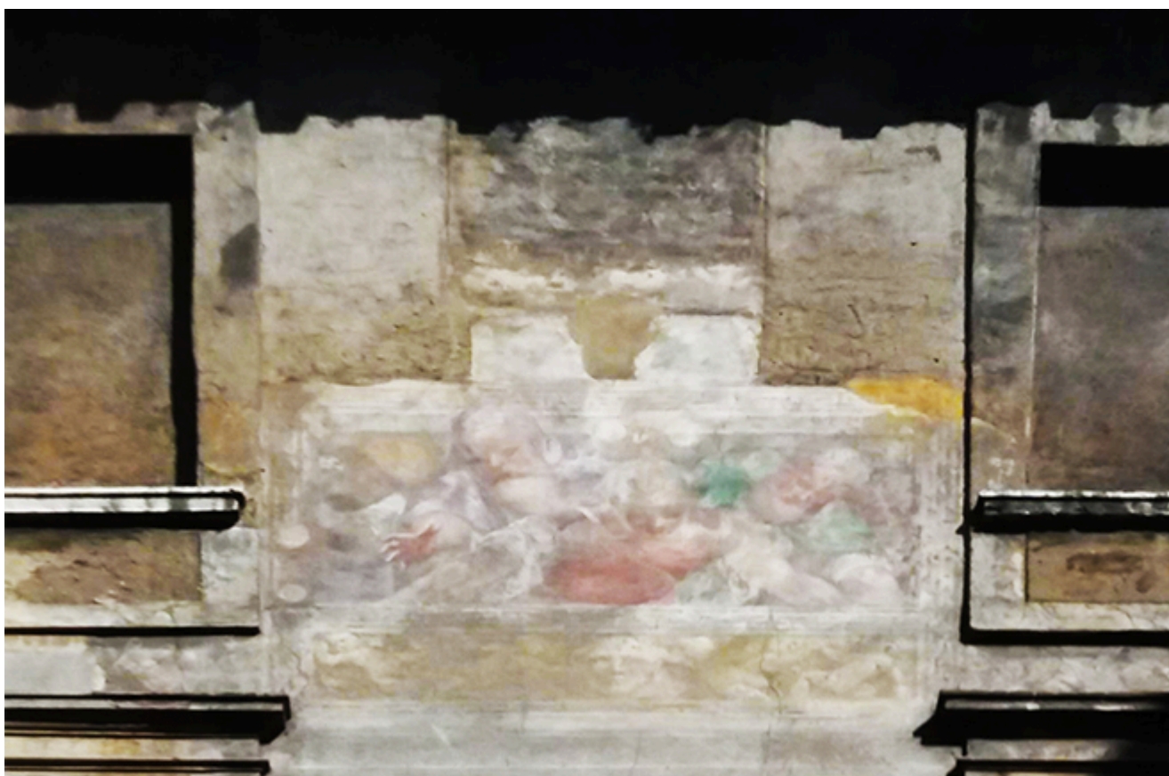
FOTO 2. Particolare dell'affresco di Lattanzio Gambara in via XXIV Maggio lungo una parete dell'edificio delle poste

delle quali, particolare per i notevoli affreschi del '500 con scene di storia romana di Lattanzio Gambara, è stata inglobata nell'edificio delle poste; edifici di importante valore storico quali le antiche pescherie, il macello risalente al Quattrocento, la chiesa romanica di Sant'Ambrogio, i resti della curia ducis romana, le fondamenta della cinta urbana tardo-antica, di una torre, di un palazzo ducale di età longobarda, tre resti di ponti sul torrente Garza. Nel 1970, durante gli scavi per la costruzione del parcheggio sotterraneo terminato nel 1974, vengono ritrovati altri importanti resti risalenti alle età imperiale e longobarda e, nel 2008, durante gli scavi per la realizzazione della metropolitana di Brescia, vengono alla luce le fondamenta di una torre di epoca medievale.