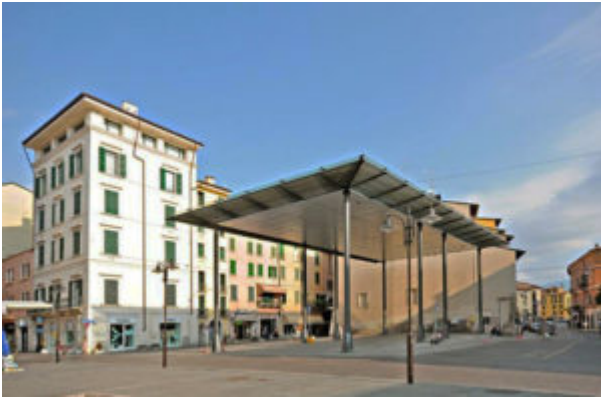
Foto 4. La pensilina

(dal Giornale di Brescia online, 30 marzo 2016)