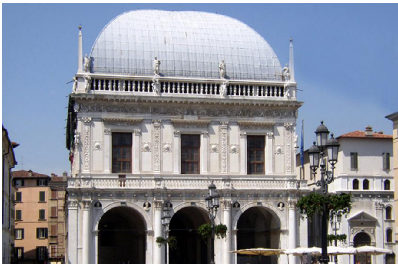
Foto 2. Palazzo Loggia

Ridiscendendo lungo la strada tracciata dalle formelle delle vittime del terrorismo, si raggiunge nuovamente Piazza della Loggia, punto d'inizio del Percorso della Memoria. Esattamente di fronte al punto in cui è esplosa la bomba il 28 maggio 1974 si trova il Palazzo Comunale, sotto il cui ampio portico una serie di lapidi, risalenti a epoche differenti, celebra i caduti per la libertà nel Risorgimento e nella Resistenza, intrecciando memorie diverse.