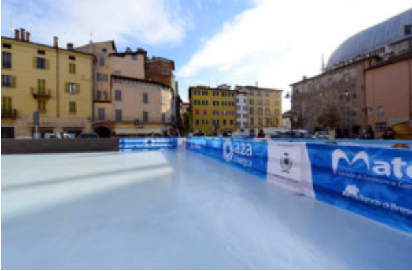
Foto 6. La pista di pattinaggio

(dal Giornale di Brescia online, 30 marzo 2016)