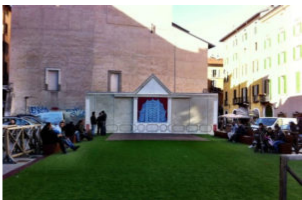
Foto 5. Il teatrino

la ricollocazione al Pescheto; 51.000 euro per le opere di carpenteria necessarie a erigerla nel parco di via Corsica; 185.000 per le opere edili richieste dal progetto; complessivamente 338.000 euro, che, sommati al contributo agli ambulanti, diventano oltre 438.000. La pensilina viene prima trasferita momentaneamente nei magazzini comunali e solo due anni dopo, nel 2012, rimontata al parco Pescheto. Nel 2010 viene bandito un concorso d'idee da cui esce vincitore il «Cubo bianco» o aula studio (con un premio di 12.000 euro all'ideatore, 8.000 al secondo classificato e 6.000 al terzo), ma l'opera, che sarebbe costata 1,4 milioni, non viene realizzata. Alla fine del 2012 si decide di allestire un teatrino di burattini destinato a spettacoli per bambini, rapidamente abbandonato a se stesso (40.000 euro).