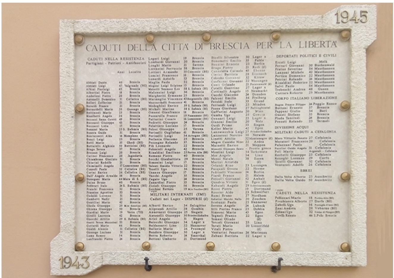
Foto 3. Lapide di Largo Formentone ai Caduti per la libertà

dell'ANMIG (Associazione Nazionale dei Mutilati e Invalidi di Guerra), che appunto censisce, cataloga, fotografa e rende pubblici i dati e le iscrizioni relative a monumenti, lapidi, steli, cippi commemorativi delle due guerre mondiali e della guerra civile del '43-'45. L'ANMIG, sorta già durante la prima guerra mondiale, a Milano nell'aprile 1917 e a settembre dello stesso anno a Brescia, inizialmente con fini solidaristici e assistenziali, nel febbraio 2002 costituisce una propria fondazione per "conservare la memoria storica di lotte, di sacrifici e di conquiste che hanno consentito all'Italia di crescere nella libertà, nella democrazia e nella giustizia sociale".